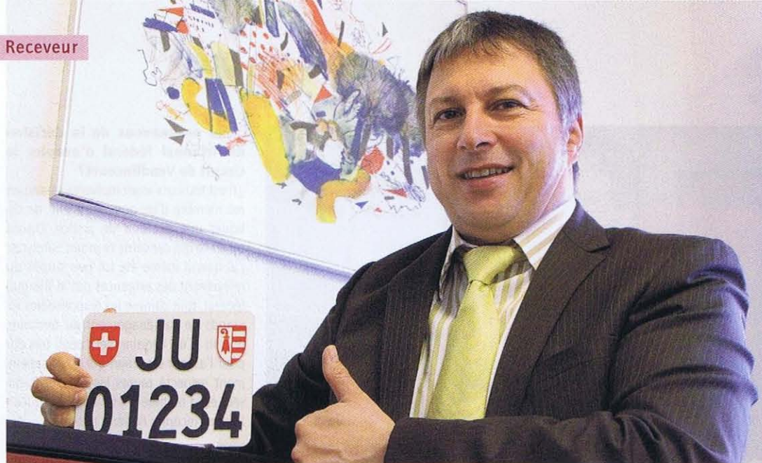
Dans son bureau, la plaque qu'il a récupérée du temps où il était à la tête du Service des automobiles du canton du Jura. Un poste qu'il a d'ailleurs occupé durant dix ans, de 1996 à 2006!