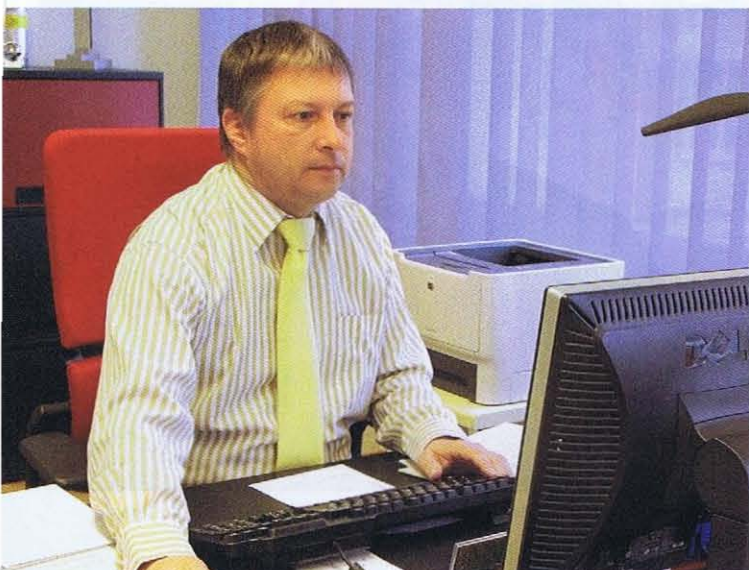
Assidu et méticuleux, même en informatique; bien épaulé, le Ministre jurassien tient les rênes de l'environnement et de l'équipement depuis la rue des Moulins, dans la capitale jurassienne.

font l'objet d'une évaluation pour la mise en place de la tôle de protection motard, même s'il n'y a pas de campagne ciblée motards sur le réseau jurassien des glissières que nous ne pouvons pas toutes remplacer d'un coup.