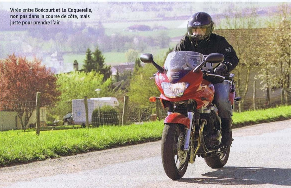
Virée entre Boécourt et La Caquerelle, non pas dans la course de côte, mais juste pour prendre l'air.

compte, sauf bien sûr si des valeurs essentielles devaient être bafouées. Comme je l'ai fait jusqu'ici, je respecterais la position adoptée par le collège. Au-delà du soutien de telle ou telle autorité, un grand projet a surtout besoin de fédérer au plus large pour avoir une chance, mais là encore, des opposants déterminés peuvent malgré tout obtenir gain de cause. Il faut surtout viser une localisation qui ne génère pas d'oppositions de principe.